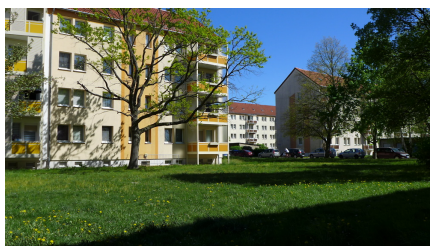
Blick zum Gebäude