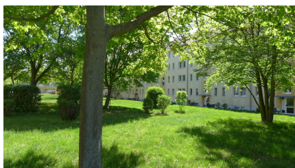
Blick ins Grüne