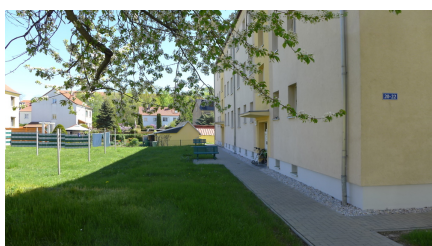
Ansicht Außenbereich des Gebäudes